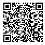
សូមស្កាន QR Code ដើម្បីចូលរួមសន្និបាតតាមប្រព័ន្ធវីដេអូ(ZOOM)