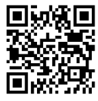
សូមស្កាន QR Code ដើម្បីទាញយកឯកសារសន្និបាត